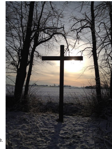
Skovkorset ved vintertide.

Vejleby: Fælles menighedsrådsmøde for Tirsted-Vejleby-Hillested-Skørtinge menighedsråd mandag den 25. januar kl. 19.00 i Rubbeløkke præstegård