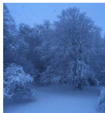
Præstegårdshaven en vinter dag.