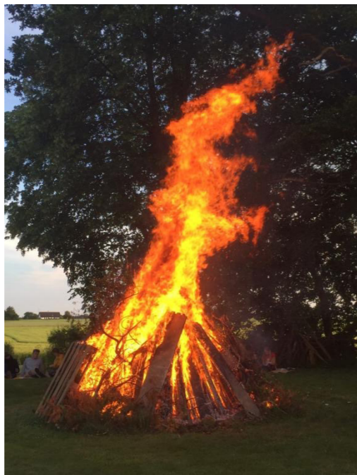
"Sidste år var der perfekt Sankt Hans vejr, og bålet flammede lystig på Lysholm"